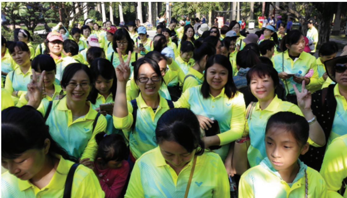
绿港集团女职工参加南宁市总工会健步走活动

为倡导文明健康的生活方式，舒缓工作压力，提高广大女职工干部身体素质，南宁市总工会于11月5日在金花茶公园组织开展一场别开生面的女职工干部健步走活动。绿港集团工会组织参加了本次活动。