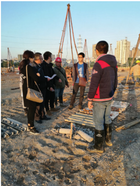
经开区收方专家小组对四小、二中进行现场收方