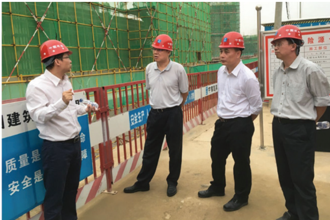
国开行山西分行行长周炼到新港家园调研

户区改造意义重大，经开区通过探索一条符合地方实际的建设模式，无论是对国家开发银行来说，还是对地方政府而言都是一个机遇与挑战。