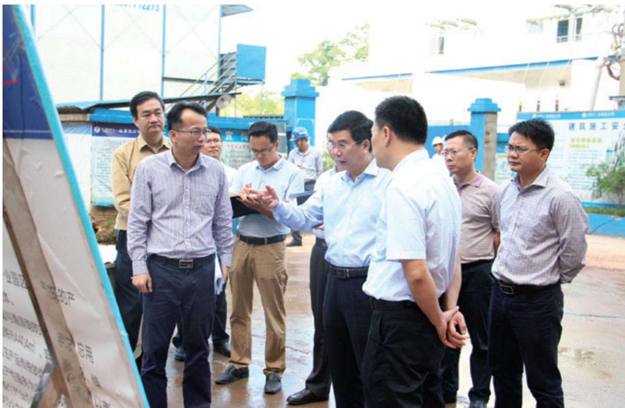
经开区党工委书记、管委会主任何尚汉深入绿港集团考察调研

11月16日，南宁经开区党工委书记、管委会主任何尚汉率队到绿港集团考察调研，充分肯定与赞赏了绿港集团对经开区社会经济发展，特别是城市基础设施建设方面承担的重大责任与突出贡献，并对绿港集团下一步发展提出了殷切的希望和要求。