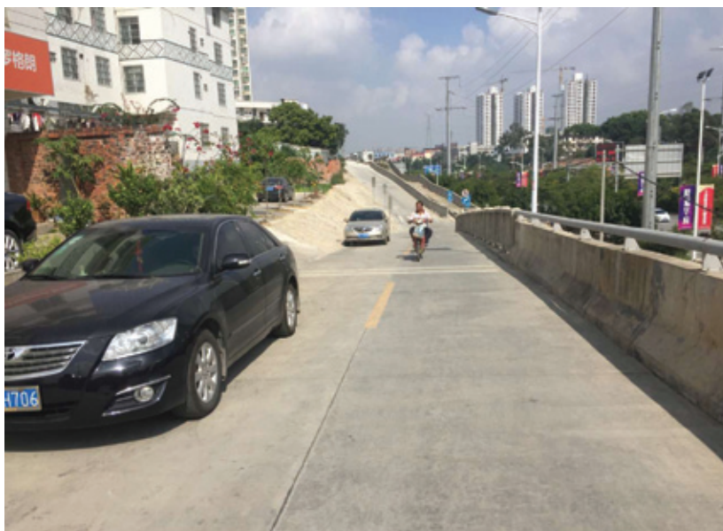
已竣工验收的友谊路便道工程

设，一边组织专家团队到现场进行调研考察，并与周边住户进行沟通协调，最终确定了在拐弯路段根据转弯半径设置超高加宽道路的措施，完美解决了该段道路施工难度大的技术问题，既为工程如期竣工争取了时间，又得到了周边群众的肯定和赞许。