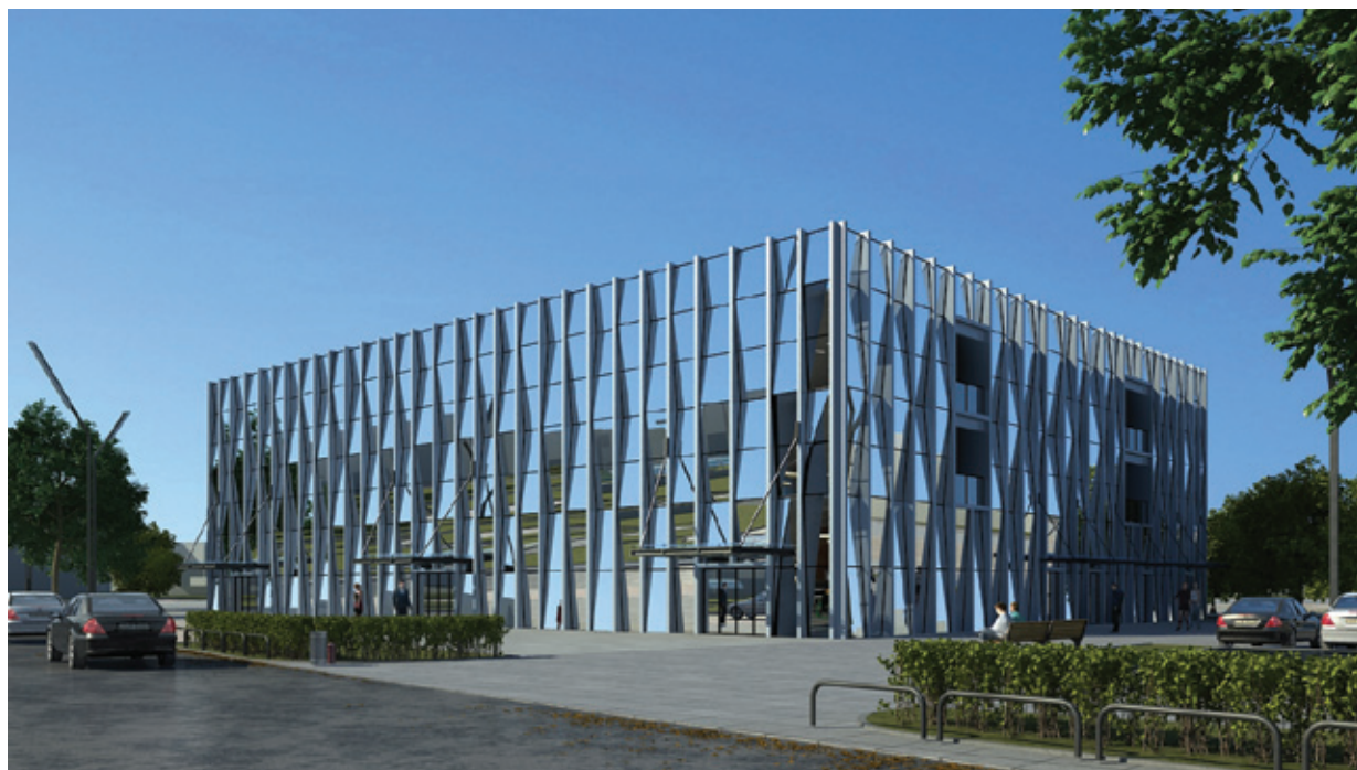
绿港·国际中心B区饭堂项目

为了公平、公正、公开地选择一家优质企业对绿港·国际中心饭堂项目进行经营，招标工作全程委托专业