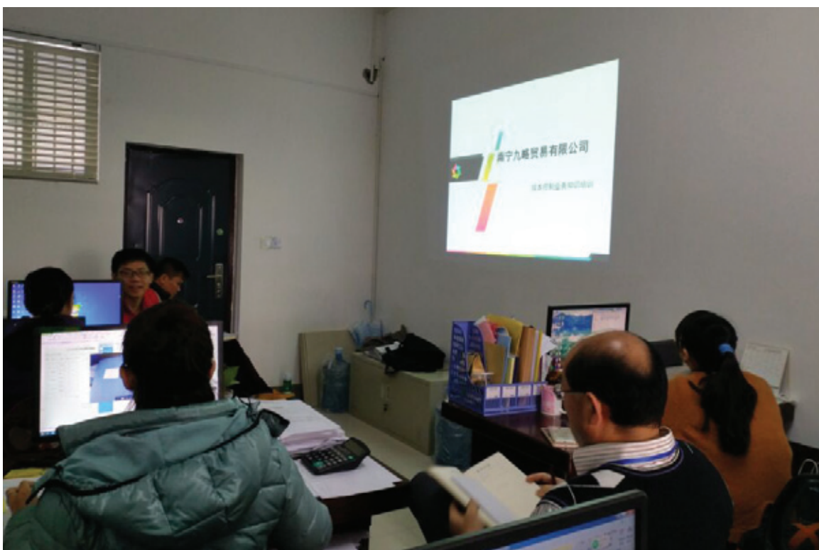
成本管理培训现场

为节约开支，控制成本，提高公司员工的经营管理理念，11月28日，绿港集团下属子公司——九略贸易公司面向全公司各部门人员开展成本控制培训。