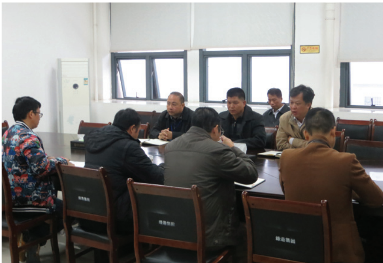
绿港集团召开安全工作紧急布置会

“11.24”冷却塔施工平台坍塌特别重大事故的发生，给社会和人民群众的生命安全造成了极大的危害和严重的影响，同时，也给我们当前的安全生产敲响了警钟。根据经开区党工书记、管委会主任、何尚汉同志及集团公司董事长、总经理杨东做出的重要批示，要求深刻吸取“11.24”事故教训，做到举一反三，立即组织开展安全生产大检查工作，全面彻底排查各类隐患，狠抓安全生产责任落实情况，切实堵塞安全漏洞，杜绝类似安全事故的发生。同时，要严格按照管委会的统一部署，结合我司2016年第四季度安全