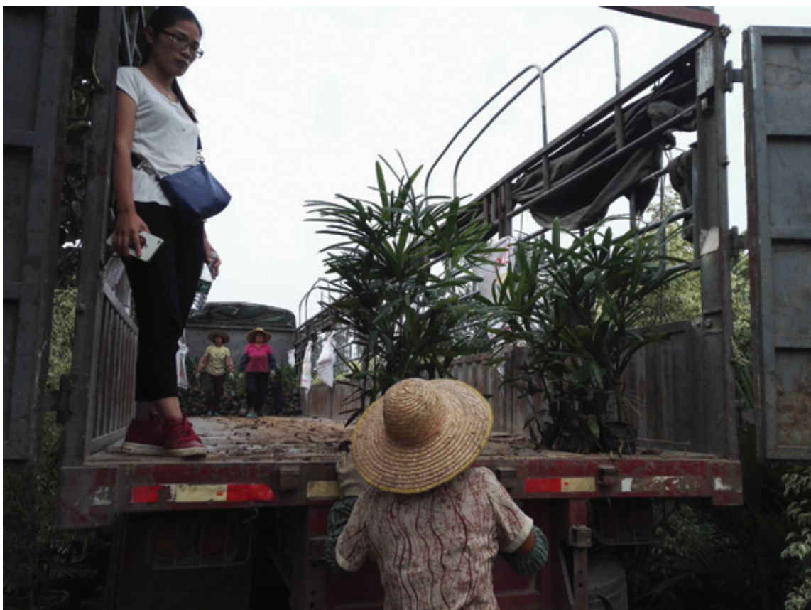
盛青公司苗木采购小组正在考察学习

通过本次考察学习，考察人员不仅了解发达地区的苗木市场信息，也充分认识到公司与广东苗木企业之间的差距。他们表示将要学习先进地区的苗木生产、管理经验及经营理念，