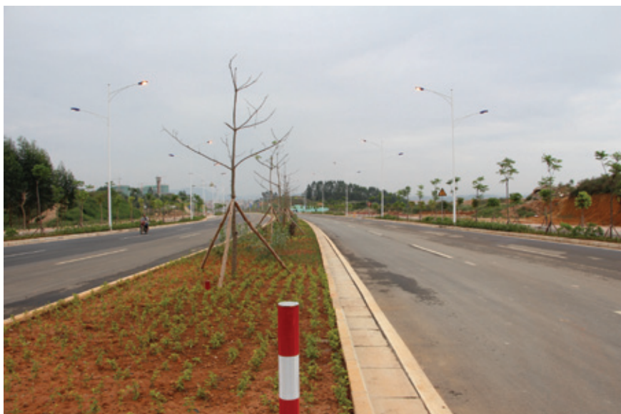
光明路一期工程项目道路顺利竣工

此次顺利竣工的光明路一期改扩建工程，是继友谊路延长线建成后的又一条城市主干路，向北可连接机场高速路，向南与明工业园相连，