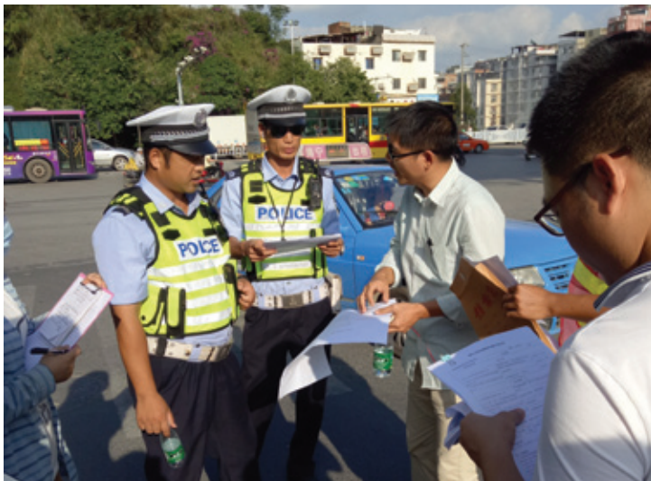
星光迎凯路口污水直排口施工协调会现场